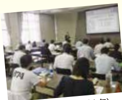
熱の入った講義(昨年)