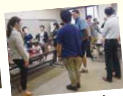
スクール中での交流会