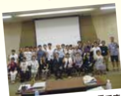
今年はあなたが参加する番です