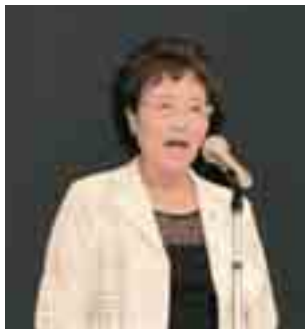
開会の辞 (遠藤群馬県女性連会長)