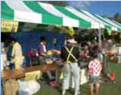
水筒補給にドリンクはいかが