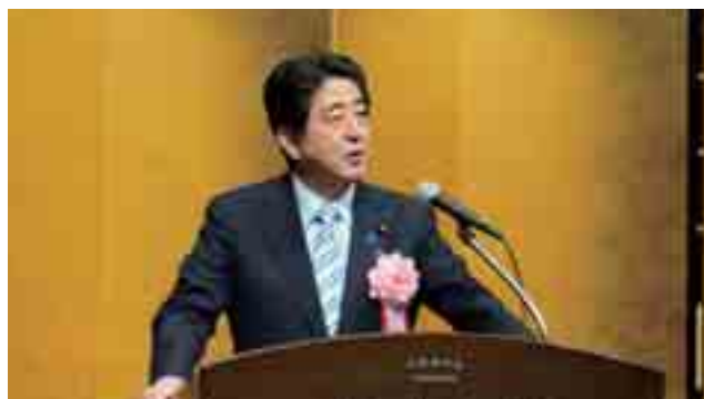
(全国商工会連合会主催「小規模企業振興政策の充実について感謝する集い」に出席された安倍総理)

商工会は「小規模企業振興基本法」制定をスタートラインとし、より一層小規模企業者支援に励んで参ります。