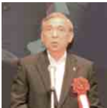
来賓祝辞（大澤群馬県知事）