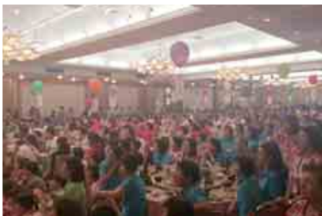
情報交換会の様子（ホテル天坊）

2日目には、群馬県内3コースに分かれて、各ブロック商工会女性部員のおもてなしによる交流視察研修会が行われ、2日間に渡って開催された研修会は成功裏に終了しました。