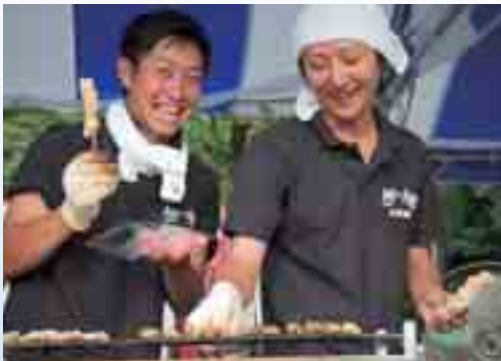
焼き台は熱いけどこの笑顔！

夏はお祭りの季節。県内各地でイベントが行われ商工会も大忙し。今回は7月27日開催の高崎市箕郷の「箕郷ふるさと祭り」の様子をレポートします。