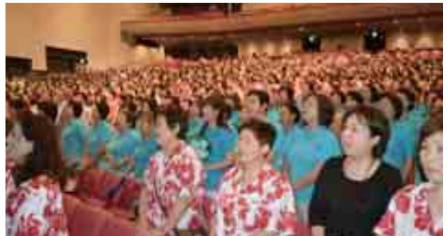
会場大ホール様子