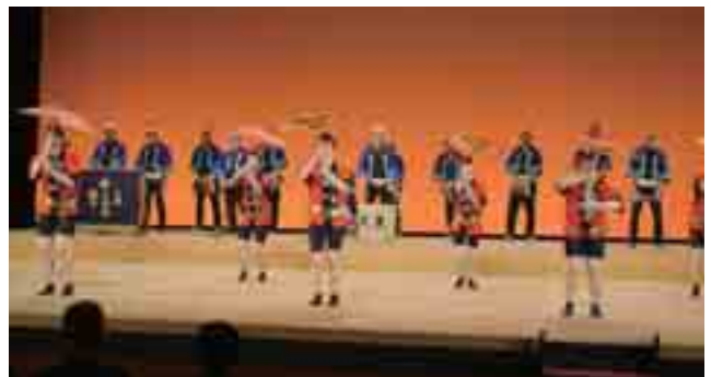
オープニングアトラクション八木節