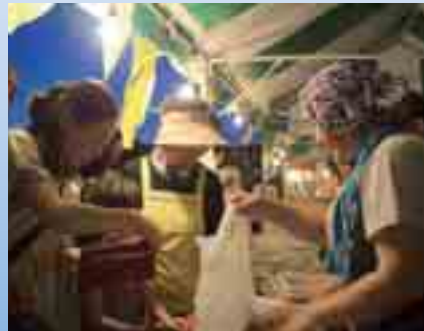
夜になってもお客様がたくさん！花火と一緒に楽しめました