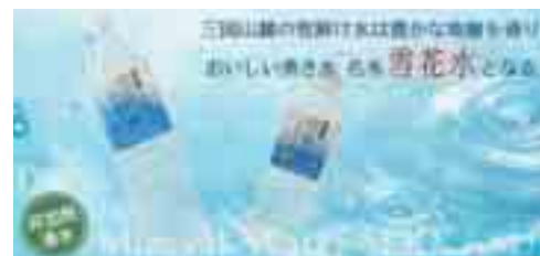
【商品名「雪花水」500ml・2L・20L・5ガロンボトルの4種類】