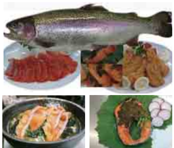
【ギンヒカリを使用した加工品】