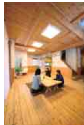
【モデルハウス内部】