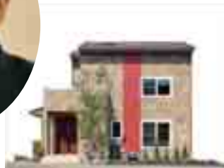
【モデルハウス外観】