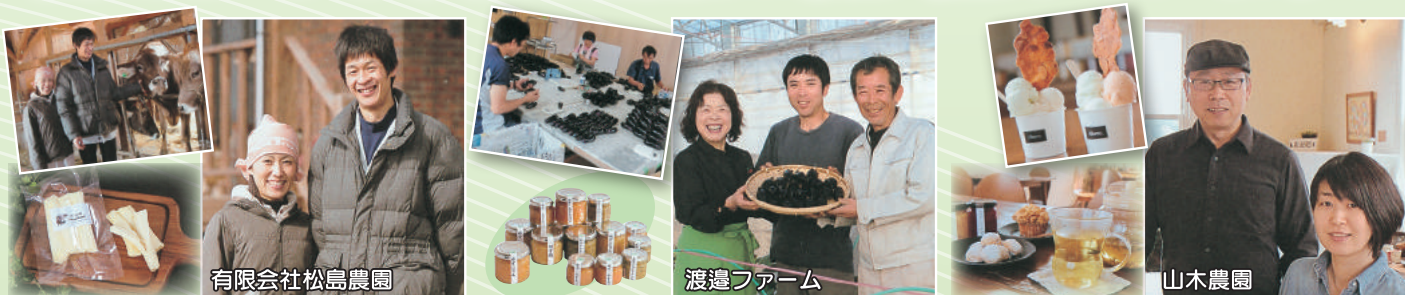
有限会社松島農園