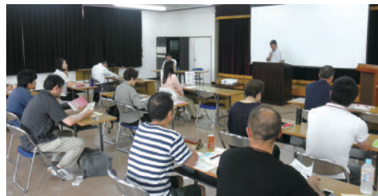
桐生みどり会場 (みどり市商工会)