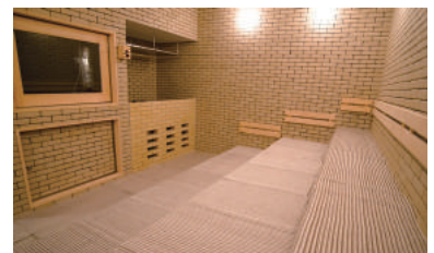
抗菌サウナマットの設置例