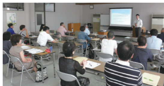
吾妻会場 (中之条町商工会)

創業や経営に必要なビジネスの基本知識と実践ノウハウを学ぶ「ぐんま創業支援塾」の吾妻会場と桐生みどり会場が7月よりスタートいたしました。各会場とも定員を上回る参加申込みがあり、集客のための販売促進術や補助金申請時に必要となる経営計画書の作成方法などについて学んでいます。10月からは西部・西南会場、東部会場の2会場がスタートいたしますので、皆様の積極的なご参加を心からお待ちしております。