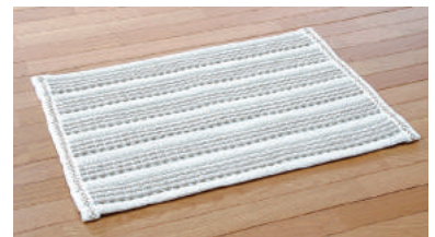
足踏み速乾バスマット

また、抗菌サウナマット「プロ仕様+α」は、サウナ室の匂いの原因となるアンモニア臭などを30分以内に80%以上分解して、乾燥も早く軽量なので臭いやマットの不快感によるクレームが減り、交換回数の減少などクリーニング経費削減や作業負担軽減に大いに役立っています。