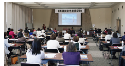
全体研修会会場の様子