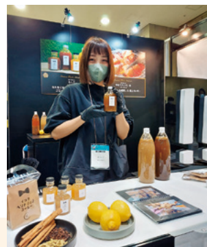
りんごのイカホヘソジンジャー

出展者は、「この展示会への参加を通じて、普段取引のできない県外のバイヤーと商談を行うことができた。新たな販路拡大につながりそうだ。」と話し、手ごたえを感じている様子でした。