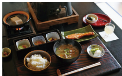
レシピをリニューアルした朝食