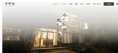
リニューアルしたホームページ

HPは常に新しい情報を掲載することで、常連のお客様はもちろん新規のお客様からも良い評価をいただいております。また、自社の強みである「朝食」についても専門家を招いて指導を受けたことにより、お客様から高評価をいただいております、より一層の強みとなりました。