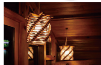
(株)木万里「オリジナル照明~Uzu~」

また、地域特産品として位置付けて、ふるさと納税返礼品や吉岡町を訪れる多くの人々に吉岡町の魅力の発信と知名度の向上に繋がる事業を実施していきます。