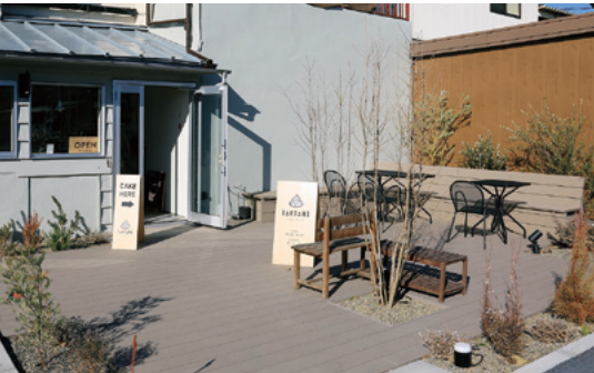
補助金で設置したテラス席