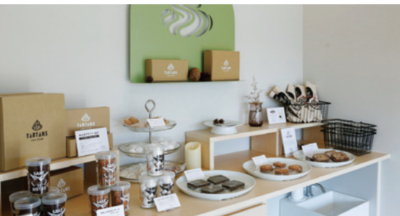
個性的な焼き菓子並ぶ