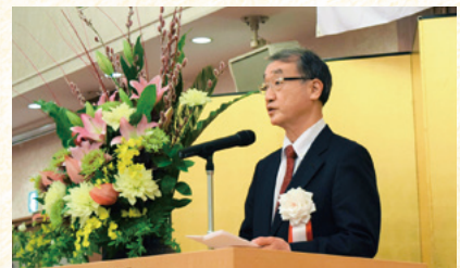
金子商工会議所連会長