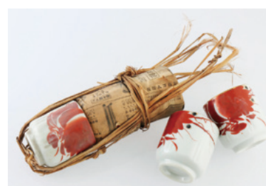
保管されていた陶器