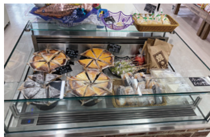
導入したショーケースと自家製スイーツ