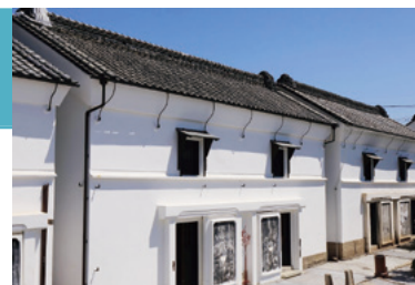
宿泊事業に活用する蔵

(株)新宇商店は大正6年(1917年)に創業した火薬商です。業務内容は産業用火薬類の販売、土木資機材の販売、火薬現場施設のレンタル、発破コンサルティング業務などを主力としており、顧客は採石業者、土木建設業者等です。新型コロナウイルスの影響で各種工事の中止や延期が相次いでおり、火薬等販売事業の受注が伸び悩み、大幅に売上が減少していました。そこで、事業再構築補助金を活用して、従来の火薬商から大幅に進化させた「築106年の蔵を活用した蔵泊事業」への新分野展開を図ることになりました。(株)新宇商店の前身は明治時代に陶器商をしており、その当時の10万点にも及ぶ陶器が蔵に保管されていました。その蔵を改修して、最大7名まで宿泊可能な蔵泊事業を開始します。体験サービスとして陶器掘り出し物蔵探検・絵手紙・お茶会・バーベキュー・もちつき・精進料理・「六角堂あずまや」の図書コーナー・映像視聴や近隣の歴史ある酒蔵醤油蔵巡り等、観光3大要素である遊ぶ・食べる・泊まるをワンストップで提供する画期的なサービスを展開していきます。