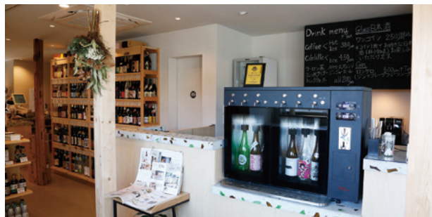
補助金で導入した日本酒サーバー