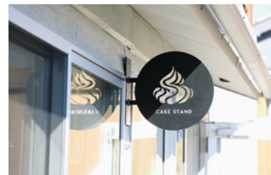
領翼さんがデザインした看板