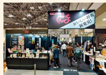
出展した「ぐんまの逸品」ブース