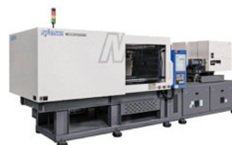
導入した射出成型機

ベルンプラスチックでは、ものづくり補助金を通じて、取引先や製品の多角化による売上の拡大と、安定化を図る事が可能な体制を構築する事ができました。