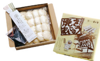
(有)庵古堂「焼きまんじゅう」