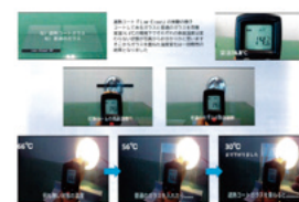
遮熱コートチラシ

持続化補助金の申請を通じて、設備投資だけでなく、事業の見直し・整理ができたことで、今後の経営の方向性についても見つめ直すことができました。今後も会社の高い清掃技術を生かし、地域を代表する企業となれるよう頑張っていきます。