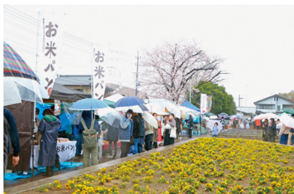
賑わう飲食店ブース