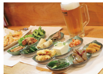
選べる晩酌セット

また、新たな取り組みとして少人数客をターゲットとした「晩酌セット」の充実を図りました。晩酌セットは16種類のおつまみから3種類選ぶことができ、アルコールが1杯付きのお得なセットです。毎日通っても飽きのこないメニュー展開を行い、高齢層の男性もフラッと気軽に立ち寄れる店舗に変わり、来店客が増加しました。