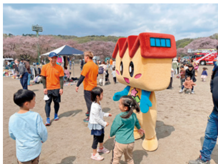
桐生市のマスコットキャラクターキノビー