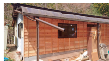
5月にオープン予定の藤屋新店舗