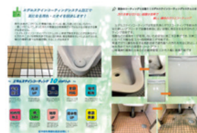
エデルステインコーティング