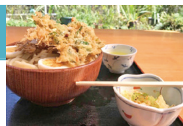
かき揚げが絶品! 藤屋のうどん

その結果、強みである洋食店経験を活かした事業再構築計画が完成。見事採択となりました。今後は拠点を地元上野村に移し、両親が経営していたうどん屋「藤屋」を復活させるべく現在鋭意努力中です。5月中旬に開店を予定しています。おいしいうどんをご用意して皆様のご来店をお待ちしております。