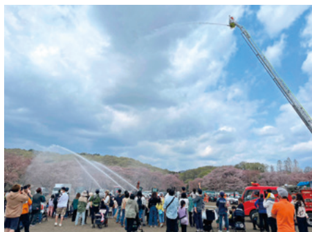
消防による放水の実演

今回のイベントを通じて、新型コロナウイルス感染症の影響で多くのことを制限されてきた地域の子どもの『笑顔』と『元気』を見ることができ、地域活性化の一翼を担えたと感じています。また、今後の地域を担う子ども達へ商工会員事業所をPRすることができ、地域に根付いた出店者支援も実施することができました。