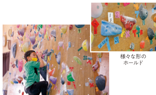
様々な形の ホールド