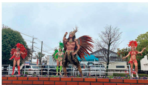
サンバステージの様子

今年はコロナ禍も落ち着き、大泉まつりや産業フェスティバルの開催も予定しており、更に大泉町を盛り上げていきます。