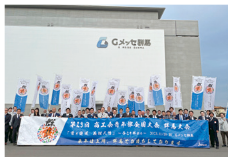
34名がスローガンのもと集合

「第23回商工会青年部全国大会(群馬大会)」は令和5年11月15日(水)、16日(木)高崎市「Gメッセ群馬」にて開催されます。全国大会開催に向けて皆様のご協力をお願いします!