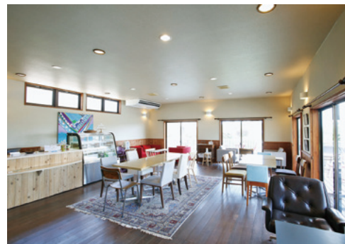
ゆったりとくつろげるALM店内