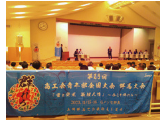
第2部 パネルディスカッション