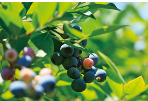
全21種類栽培しているブルーベリー