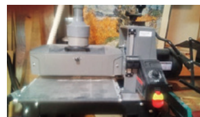
導入した機械装置