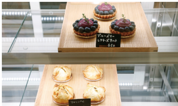
旬のタルトと通販サイトで人気のマロンパイ