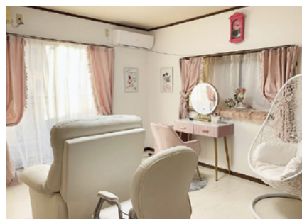
新設した目元施術スペース