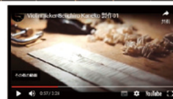
ホームページに製造工程の動画を掲載