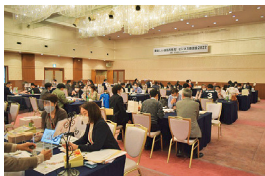
昨年度の商談会の様子

群馬県産の加工食品に関心のあるバイヤー様(百貨店、スーパー、小売、食品卸、ホテル・旅館、道の駅、飲食店等の買い手企業、通販事業者等)のご参加をお待ちしておりますので、奮ってお申し込みください。