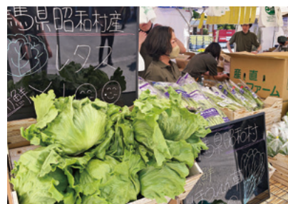
大人気の昭和村産レタス

出店した4日間は天候には恵まれませんでした。毎日開店前から訪れるお客様もいるなど大変好評で、昭和村ブースの農産物を心待ちにしている方も多く、「やさしい王国昭和村」をPRする絶好の催事となりました。