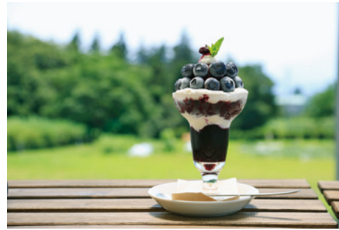
今が旬のブルーベリーパフェ