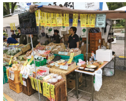
様々な加工品も好評