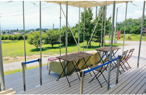
景色とスイーツが楽しめるオープンデッキ席