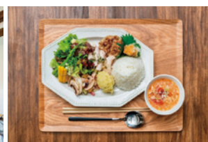
週替わりのランチプレート