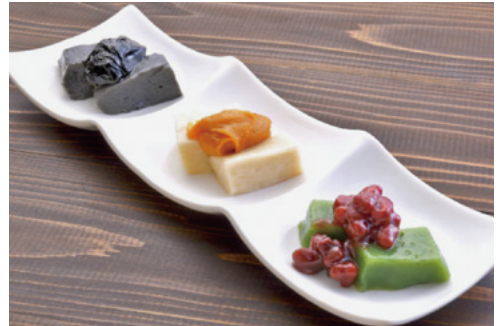
大地と水の和菓子はあて