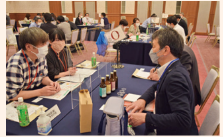
個別に商談をする事業者