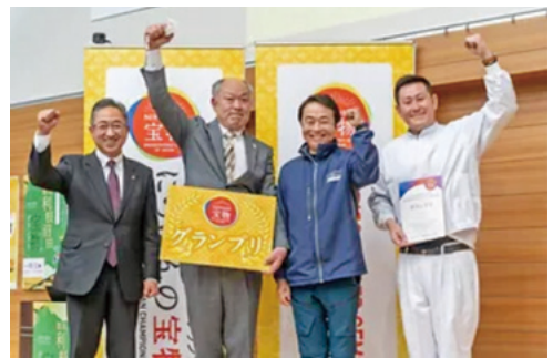
新和素材スイーツ部門でグランプリ!