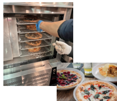
焼きたてのピザを「ブラストチラー」で急速冷凍