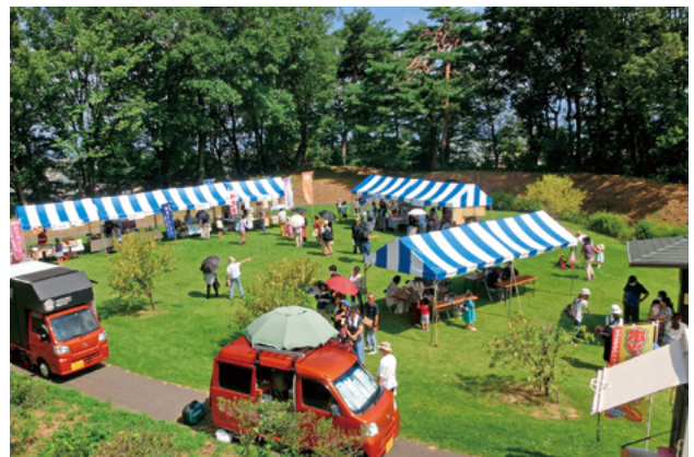
飲食店のキッチンカーなどが集合

第1回の開催となった本マルシェは、北群馬地域の今後のイベント造成モデルや、新たな特産品の発掘の場として位置付けられており、第2回は榛東村内での開催を検討しています。