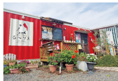
赤いコンテナが目印の店舗

商工会の支援を通じてできた、地域の人たちとのつながりを大事にしています。地元邑楽町で採れた野菜や果物を使った旬なメニューを提供することで、地域食材のPRにも役立てていきたいです。