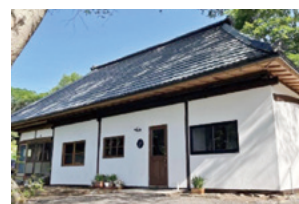
和モダンな雰囲気の外観

持続化補助金の活用により希望が実現しました。また、事業計画作成を通し経営構想を見つめ直すことも出来ました。嬭恋村商工会には創業当時から様々なご支援をいただき大変感謝しております。