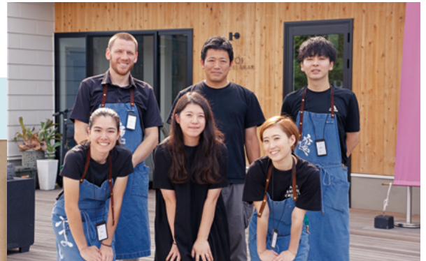
林さん夫妻とスタッフの皆さん