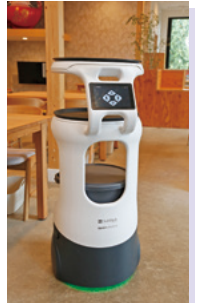
導入した配膳ロボット