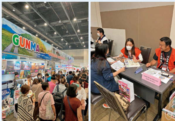
賑わいを見せた群馬県ブース プロモーションを行うスタッフ

その一環として、令和5年9月1日(金)~3日(日)にタイの首都バンコクで開催された「バンコク日本博2023」に出展し、本県からは8社並びに行政職員、伴走支援を行う各商工会職員が現地を訪問し観光プロモーションを実施しました。会場内は行動制限が解除されるのを待ち侘びた来場者や旅行会社で溢れ返り、来場者数は過去最高となる129,000人を記録するなど、本気度の高い消費者や旅行会社に対する効果的な商談や観光プロモーションにつながりました。