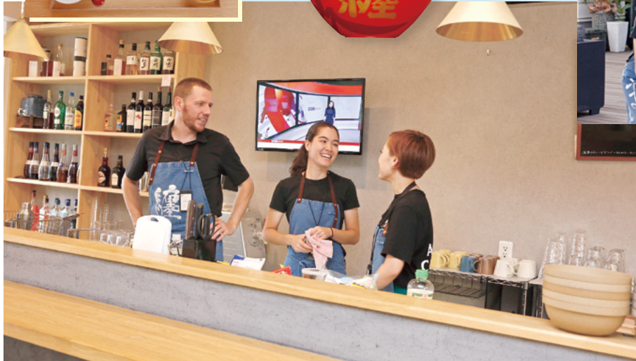
大きく開放的なバーカウンター