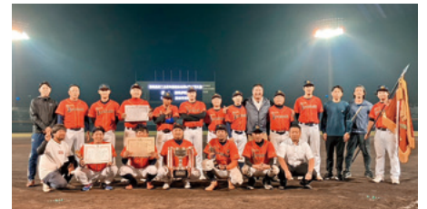
優勝した群馬伊勢崎商工会青年部

県商工会青年部連合会第54回野球大会が8月29日(火)と10月4日(水)に開催されました。8月29日(火)は1・2回戦が前橋市桃ノ木川グラウンドで、10月4日(水)は準決勝・決勝が上毛新聞敷島野球場で行われました。今大会は県内商工会青年部8チームが出演し、決勝戦では群馬伊勢崎商工会青年部が沼田市東部商工会青年部を5-4で下し、2連覇を果たしました。