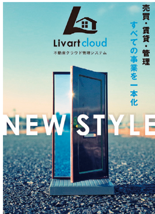
不動産管理システム「Livartクラウド」