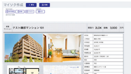
Liv artクラウド管理画面