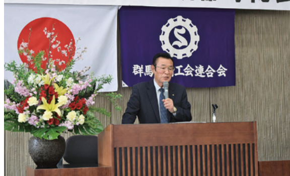
挨拶をする石川会長