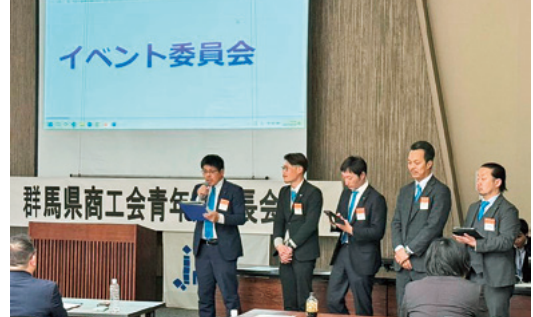
県青連各委員会の事業報告