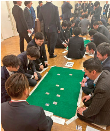
第3部「第2回上毛かるた大会」

第3部「第2回上毛かるた大会」では、県内各ブロック青年部から31チームが参加しました。予選リーグと決勝トーナメントを実施し、中部ブ