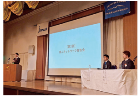
第2部「商人ネットワーク報告会」