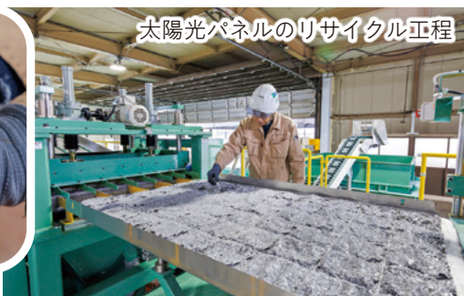
太陽光パネルのリサイクル工程