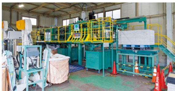
事業再構築補助金による導入設備一式