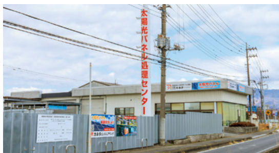
(有)カネタエンジニアリング外観