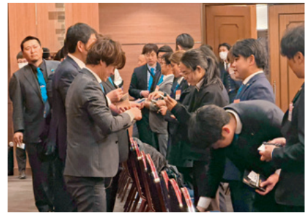
第4部「青年部ビジネスマッチング」