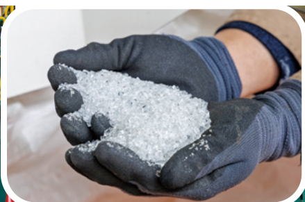
太陽光パネルの再生素材