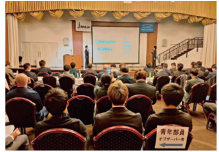
第1部「青年部長会議」

第4部「青年部ビジネスマッチング」では、業種別の名刺交換会と交流会を実施。一連の研修を通して、参加青年部員たちは「販路・需要の開拓」と「強固なネットワークの構築」という確かな手応えを得ました。ここで育まれた絆と知見が、群馬の未来を担う大きな原動力となることを期待させる一日となりました。