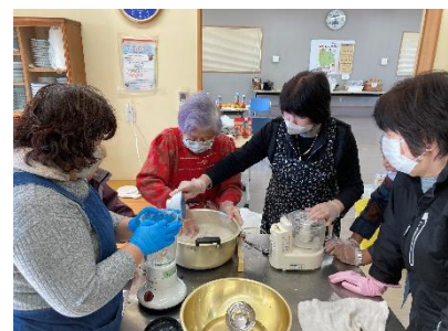
【女性部事業の様子】